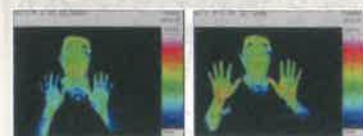
『摩訶クリーム』を手に塗って25分後、温まっていることがわかります。